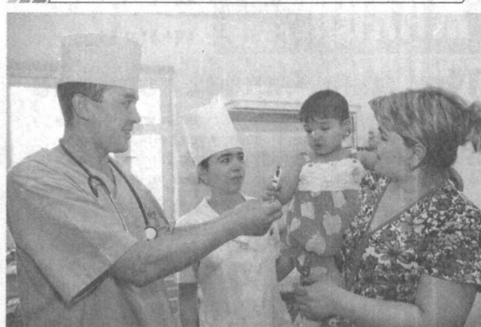
Истиқлол йилларида мамлакатимизда тиббиёт соҳаси тубдан ислоҳ қилинди. Натижада ушбу тизимда нафақат замонавий технологиялар жорий қилинди, айни пайтда хизмат кўрсатиш сифати ҳам яхшиланди. Бундай имконият ва имтиёزلардан фойдаланаётган Навоий вилояти соғлиқни сақлаш тизими мутасаддилари ҳам инсон саломатлигини асраш борасида бир қатор ибратли ишларни амалга оширмақдалар.