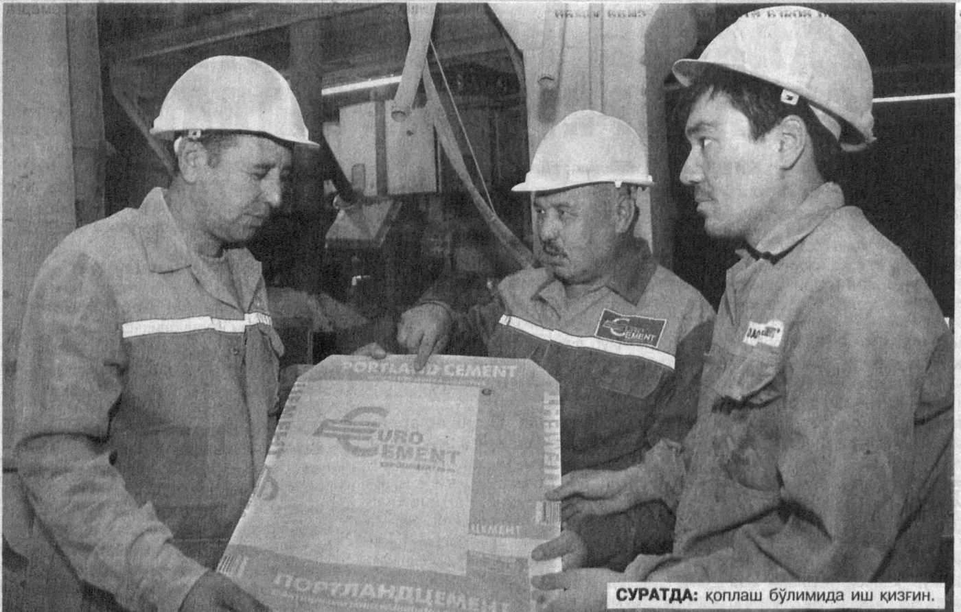
СУРАТДА: қоплаш бўлимида иш қизгин.

Сайд РАҲМОНОВ, «Халқ сўзи» мухбири.