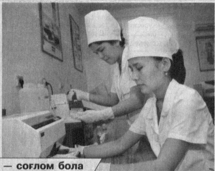
Соғлом она — соғлом бола

Республика "Она ва бола" скрининги марказининг Нукус филиалида ҳам тугиш ёшидаги аёллар ва гўдаклар соғлиғи муҳофазаси бўйича ибратли ишлар қилинаптир.