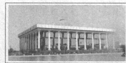
Андижон вилоятидаги Олий Мажлис Қонунчилик палатаси кўмитасининг йиғилиши бўлиб ўтди.

Олий Мажлис Қонунчилик палатасида Қонунчилик ва суд-ҳуқуқ масалалари кўмитасининг йиғилиши бўлиб ўтди. Унда “Адвокатура тўғрисида”ги ҳамда “Адвокатлик фаолиятининг кафолатлари ва адвокатларнинг ижтимоий ҳимояси тўғрисида”ги Ўзбекистон Республикаси қонунларининг Андижон вилоятидаги ижроси тўғрисидаги масала муҳокама қилинди.