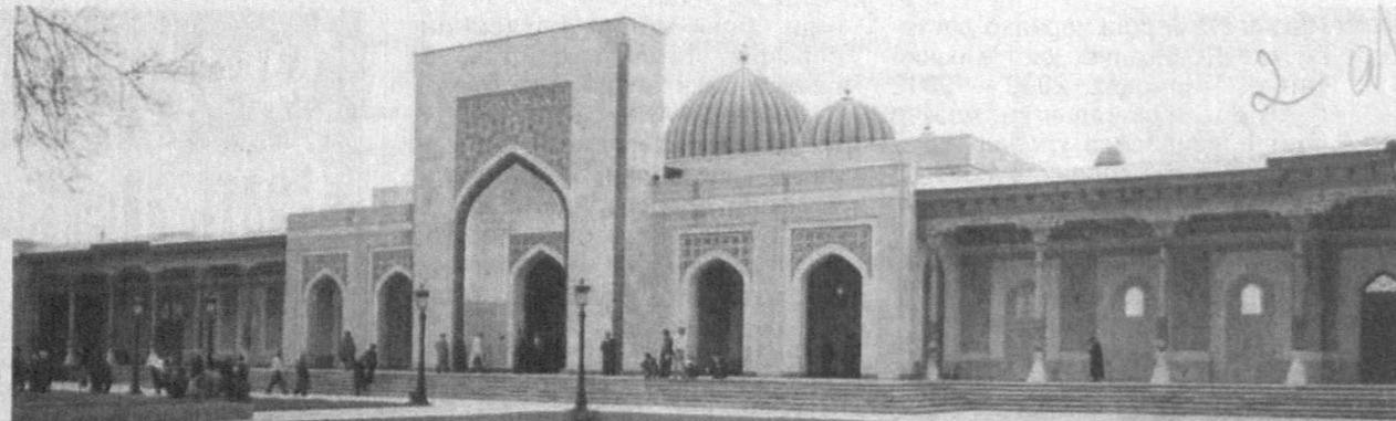
Бундан роппа-роса ўн икки йил муқаддам — 1998 йилнинг 23 октябрыда Самарқанднинг Челақ туманида «Ҳадис илмининг султони», «Бутун дунёнинг имоми», «Барча муҳаддисларнинг сарвари» дея шарафланган буюк ватандошимиз Абу Абдуллоҳ Муҳаммад ибн Исмоил ал-Бухорий таваллудининг ҳижрий ҳисобда 1225 йиллиги муносабати билан маҳобатли ёдгорлик мажмуасининг тантанали очилиш маросими бўлиб ўтганди. Ушбу маросимда Президентимиз Ислам Каримов нутқ сўзлаб, жумладан, шундай деган эди: «Имом ал-Бухорий ҳазратлари нафақат ўзбек халқи, балки бутун мусулмон оламининг фахр-ифтихоридир. Ул табарруқ зотнинг ҳаёти том маънодаги илмий ва инсоний жасорат, буқилмас ирода, сўнмас эътиқод тимсолидир».