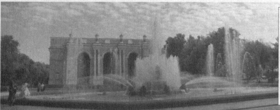
Истиқлол туфайли юртимизнинг барча масканларида бўлгани каби пойтахтимиз Тошкентнинг диққатга сазовор жойлари, хиббон ва сайилгоҳларига ҳам мухташам фавворалар ўрнатилди. Уларни томоша қилар эканмиз, битмас-туганмас завку шавқ олишимиз табиий. Хусусан, пойтахтнинг қоқ марказида жойлашган Алишер Навоий номидаги опера ва балет катта академик драма театри hovlisidaги фаввора истиқлолимизнинг ўн тўққиз йиллик тантаналари арафасида янгича кўринишга эга бўлди.