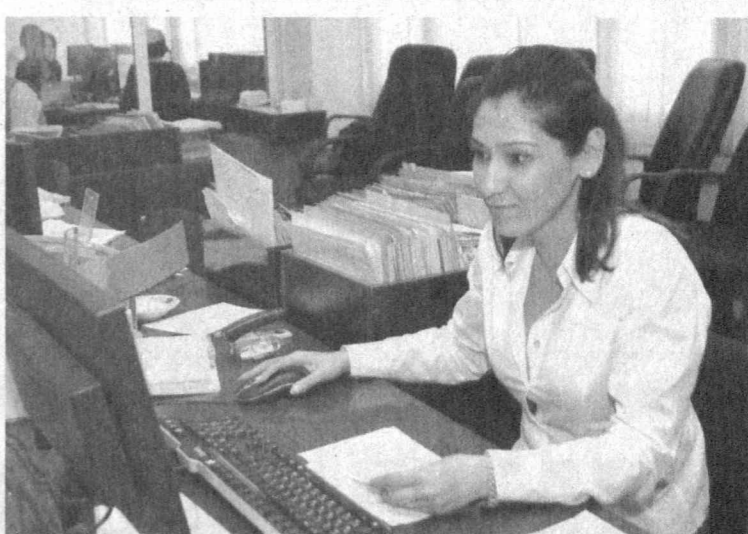
Мажбуриятларини, у томонидан жалб қилинадиган маблағлар ҳажмининг оширишдан иборат. Шу маънода,

Ташкил этган бўлса, жорий йилнинг шу даврига қадар 1 миллиард 291 млн. 581 миң сўмга ортган. Мазкур депозитлар бўйича омонатчиларга очилган ҳисоб рақамлари 1462 тага етди. Бугунги кунда мазкур молия муассасасида аҳоли бўш пул маблағларини банк-жабл этиш юзасидан диққатга сазовор ишлар олиб борилапти. Бунинг учун қўллаб-қувватловчи хизматлар жорий этилиб, аҳоли учун қўлай шартларда янги омонат турлари тақдим қилинапти. "Қомус", "Устоз", "Сармоя", "Коммунал бонус", "Бахтли бола-