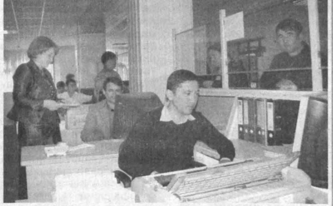
Миллий банк Сирдарё вилояти бўлимининг иши бунга яққол мисол бўла олади.