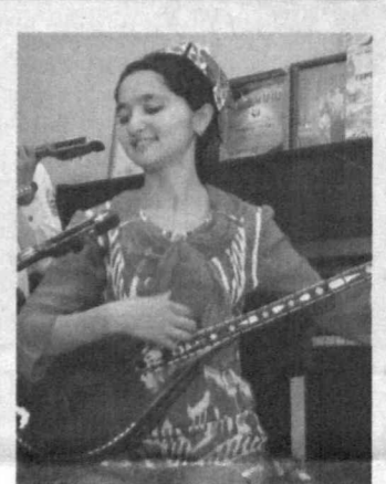
"Анъанавий созандалик" йўналиши бўйича биринчи ва иккинчи ўринга лойиқ, деб топилди.

оширмоқда. Ёш истеъдодлар турли нуфузли кўрик-танлов-ларда муваффақиятли қатна-шиб, юқори натижаларни кўлга киритмоқдалар. Чунон-чи, улар ўтган йили "Болалик баҳори" республика фестива-лининг яқуний босқичида