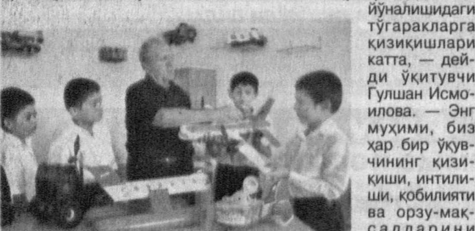
СУРАТДА: Сарийосё туманидаги ўқувчилар техник ижодий-ти маркази фаолиятдан лавҳа.

чан болалар бугун кам эмас. Миллий хунармандчилик, баддий ижодкорлик ҳамда техник йўналишдаги 30 та тўғраққа 722 нафар ўқувчи жалб этилган. Кувонарнинг, "Учувчи самолётлар иxtирочилари", "Варрақлар сайли", "Еш фазогирлар", "Эркин учувчи самолёт" каби нуфузли кўрик-танловларда марказ иxtирочилари фахрли ўринларни эгаллашмоқда.