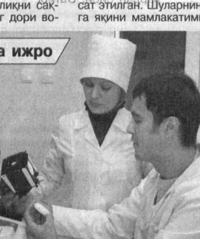
Фармон ва ижро

тиббий буюм давлат рўйжа-тидан ўтказилиб, тиббиёт амалиётида қўллш учун рух-сат этилган. Шуларнинг миң-ға яқини мамлакатимиз кор-