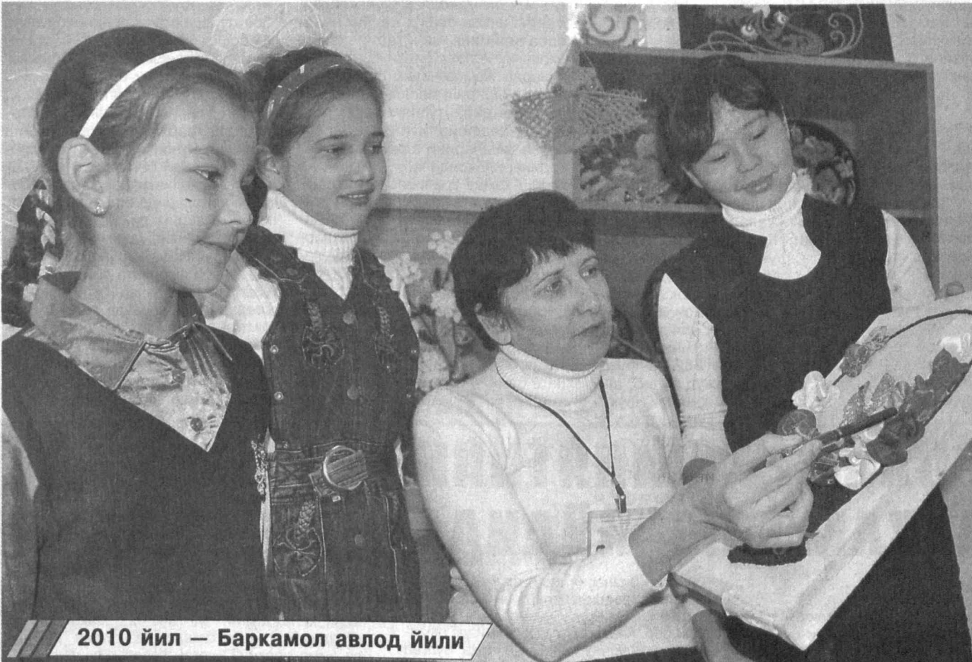
2010 йил — Баркамол авлод йили

Айни пайтда ушбу ҳужжат билан тасдиқланган Давлат дастури доирасида мусиқа ва санъат мактабларининг моддий-техник базасини мустаҳкамлаш, фаолиятини такомиллаштиришга қаратилган бир қатор ишлар амалга оширилмоқда. Жумладан, Жиззах вилоятида қарор талабларига мувофиқ, мавжуд 17 та болалар