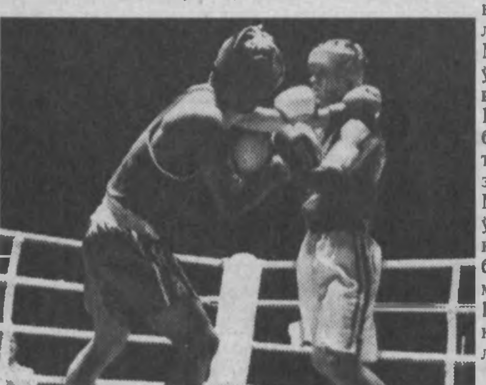
Муҳаммад Али ва Покистон боксчиси рингда

Шунингдек, юрдошларимиздан Дилшод Йўлдошев, Руслан Чағаров, Карим Тулагов, Темурали Тўрақов ва Наримон Отаев 1/4 финалда қатнашиш ҳуқуқини қўлга киритишди.