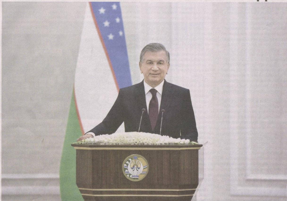
В Нурафшоне 3 июня под председательством Президента Шавката Мирзиёева состоялось совещание с участием актива Ташкентской области, хокимов и руководителей секторов, ответственных лиц министерств и ведомств.

Глава государства отметил, что сам лично знакомится с положением дел на местах, направляет туда руководителей республиканского уровня, таким образом решаются самые актуальные вопросы. Везде происходят преобразования, но Ташкентская область никак "не просыпается".