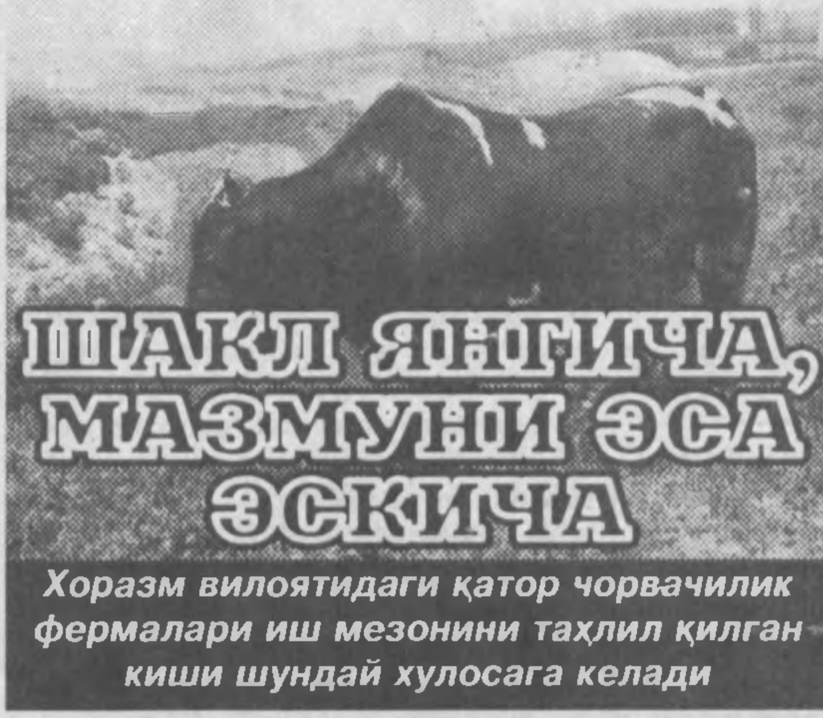
ШАКЛ ЯЎНИЧА, МАЗМУНИ ЭСА ЭСКИЧА

ИККИНЧИ босқичга кирган ислохотлар жараёни бошқа соҳалар каби мамлакат чорвачилиги жаҳадида ҳам ўз таъсир доирасини кенгайтирмоқда.