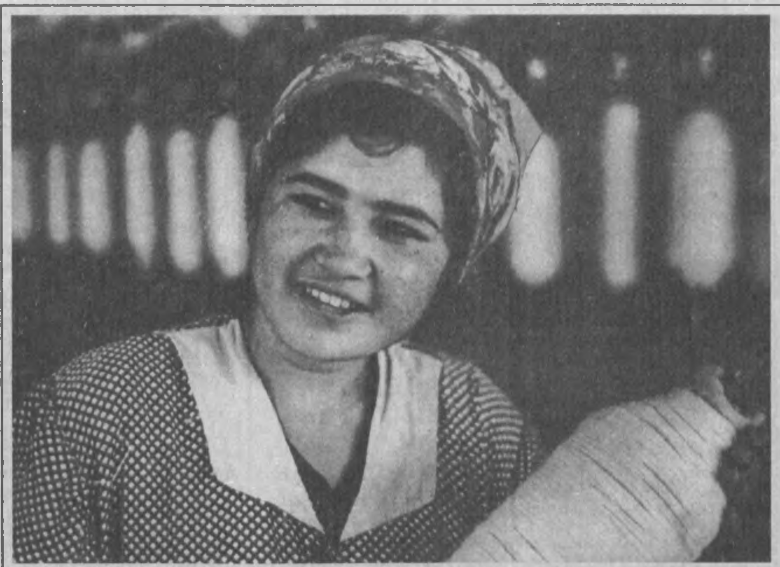
Бешариқ туманидаги «Рақон» жамоа ҳўжамка катта фойда келтириш билан бирга аҳолини иш билан таъминлашда катта аҳамият касб этаптир.

— Ўзбекистонлик мутахассислар билан АЙРЕКСнинг ҳамкорлиги Тошкентда ваколатхонамиз очилганидан кейин бошлангани йўқ.