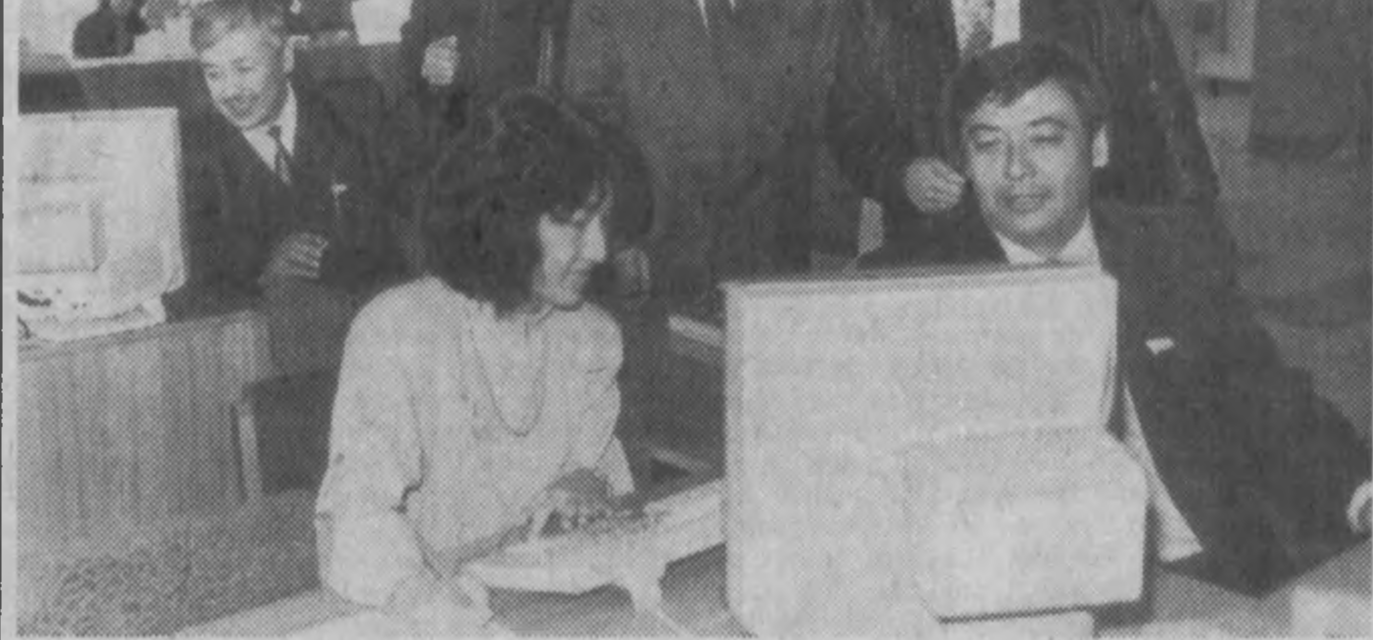
СУРАТДА: депутатлар рўйхатдан ўтишмоқда.