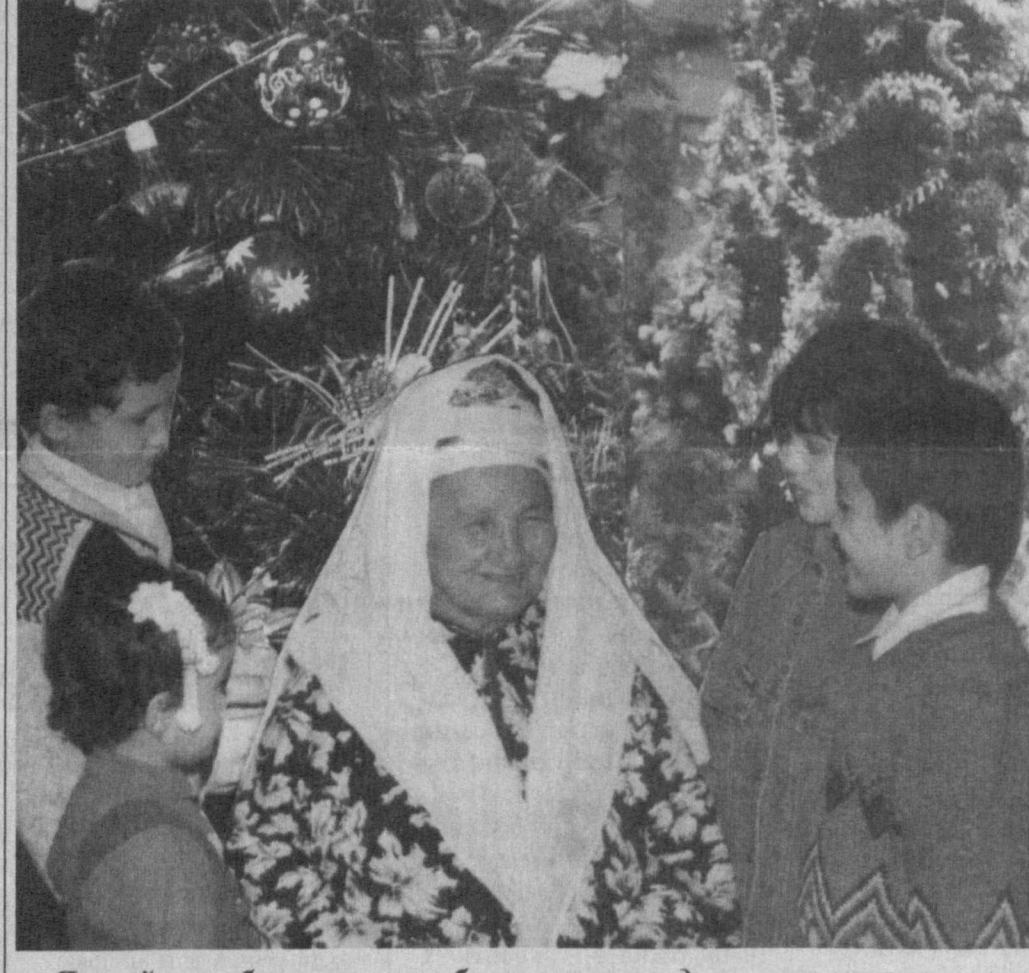
Янги йилни бувижонимиз билан қаршиладик.