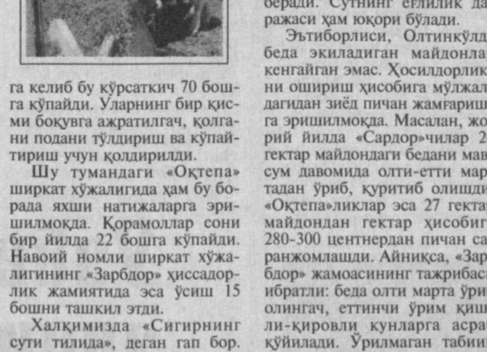
Иёл муқаддам ҳар юз бош сизгирдан 68 бош буюқ олинди, уларнинг ҳақмаси ўстиришга қолдирилган бўлса, жорий йил...

бод этилмоқда. Қорамоллар бош сонининг тобора камайиб бораётгани соҳа мутасаддиларини ташвишга солмапти. Бундай дейишимизга асос бор. Маълумотларга қараганда, туман бўйича қорамоллар бош сони бир йилда 583 тага озайган, 65 тонна гўшт, 381 тонна сут кам тайёрланган. Нега?