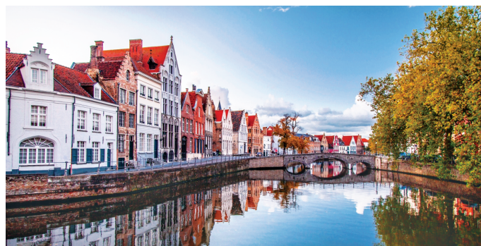
(Давоми. Бошланиш 1-бетда).

Президент Ислам Каримов ташаббуси билан ишлаб чиқилган "Соғлом