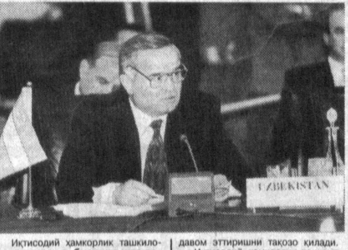
Иқтисодий ҳамкорлик ташкилотининг асосини қўриган бўлиб келишга қарор қилинган эди.

Мухтарам Раис жаноблари, Мухтарам Бош қотиб жаноблари, Давлат ва ҳукуматларнинг мухтарам бошқислари, вақиллари, Хонимлар ва жаноблар, Менга Ўзбекистон делегацияси номидан Туркистон Республикаси раҳбариятига, энг аввало, Сапармурот Ниезовга бизга қўрсатилган меҳмондўстлиги учун сарқилинган миннатдорлик билдиришга икжозат бергайсизлар.