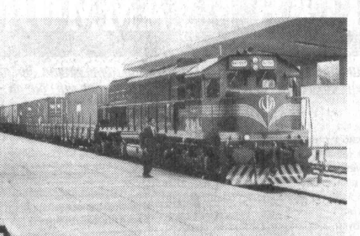
Ушбу йўлни бириктириш бўлиб келишга қарор қилинган эди. Ана шу қарор асосида Ўзбекистон-Италия йўлининг ҳам аҳолининг ҳаётига кўпроқ таъсир қилган бўлиши мумкин.

1991 йил декабрида Марказий Осиё давлатларининг Ашгабат уршаувида Тажик — Сарас темир йўлини бириктириш бўлиб келишга қарор қилинган эди. Ана шу қарор асосида Ўзбекистон-Италия йўлининг ҳам аҳолининг ҳаётига кўпроқ таъсир қилган бўлиши мумкин. Тажик — Сарас темир йўлининг бириктирилиши вақилларининг йўналишига қаратади.