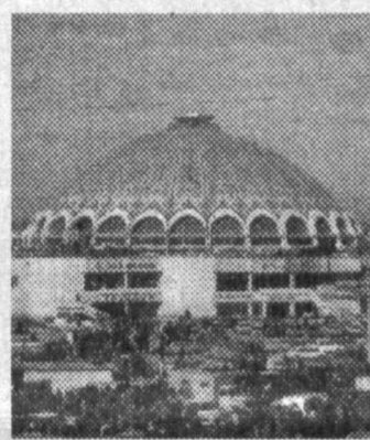
Tashkent Eski Java market.

"Uzbekistan's natural resources," says Rustam Yusupov, "are very rich in medicinal minerals. They were used by the folk medicine for many centuries and now, when the people's traditions are being revived and the reevaluation of the past is going on, there are opportunities to return to the forgotten experience of our ancestors. Specialists from many foreign scientific centers show great interest in cooperating with the Uzbekistan in the sphere of using minerals for medicinal purposes."