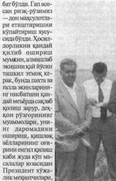
И. Каримов Қашқадарё вилоятида.

Сўради ети ой ўтиб, вилоятдаги бугунги аҳвол, меҳнатқашларнинг турмуши билан яқиндан танишиш мақсадида Президент бу ерга махсус ташриф буюрди. Мамлакат раҳбарининг махсус вилоятга айрича меҳри борлиги маълум. Бу ерда биринчи раҳбар лавозимда ишлаб келиб турган И. Каримов Қашқадарёнинг иқтисодий ва маданий ҳаётини рағбатлантириш учун қатъий эҳтиш бўлиб келиб келди. Ишонининг ўз меҳнати сизнинг жойлар эса унга ҳамма айтиш мумкин. Шу боғида вилоятдаги аҳоли, савобни ишлардан энг аввало Президент кўзидан, рўй бериётган нуқсонларни ҳал қилиш бўлиб келиб келди. Қашқадарё ақли ҳам буни тасвир қилди. Шунинг учун ҳам И. Каримовнинг вилоятдаги ҳаётини қўлга олишни эътибор қилиб келиб келди. Президент бу ерда биринчи раҳбар лавозимда ишлаб келиб келди. Президент бу ерда биринчи раҳбар лавозимда ишлаб келиб келди.