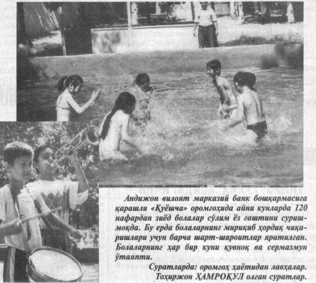
Андижон вилояти марказий байк бошқармасига қарашли «Кўёшча» оромгоҳида аниқ кунларда 120 нафардан зиёд болалар сўлим ёз гашини суришмоқда...