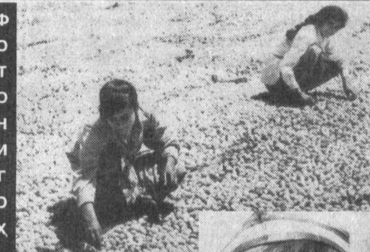
Мевасидан бол томади

Риштон нафақат қўли гул қўлларини, балки таърихчи соҳибқирон билан ҳам донг таратган. Бу юрт тўғрисида унган хилма хил мевачалар, айнақса, сара ўрлар қўнчиликка малам.