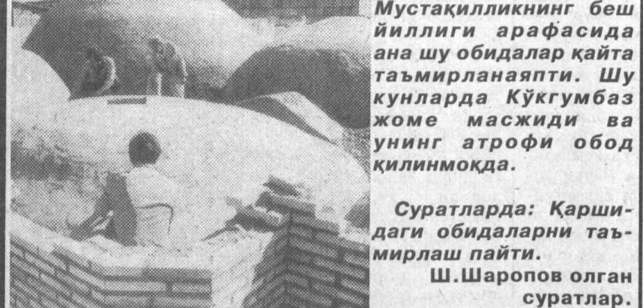
Суратларда: Қаршидаги обидаларни таъмирлаш пайти.