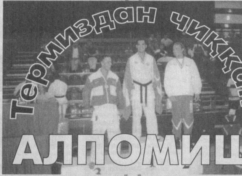
Термиздан чиққан АЛПОМИШ

То ўзгучи арапанга рост бўлдим, Ўз феълимдан чўпу хасови наст бўлдим. Худони уртага солиб дўст бўлдим, Келган меҳмон сенинг ўзлениг бўлди. Сирожиддин САЙИД.