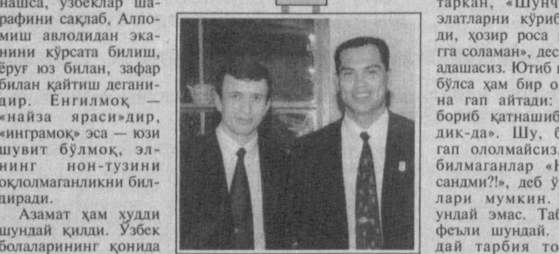
«Ватан ягонадир, Ватан биттадир» танловига

Азамат ҳам худди шундай қилди. Ўзбек болаларининг қонлида алломишларнинг шиддати сўнмаганини, ору номус барҳаёт эканини исботлаб берди. У ўзининг бўй-бастини, ҳақиқий маъҳоратини илк марта 1992 йилда