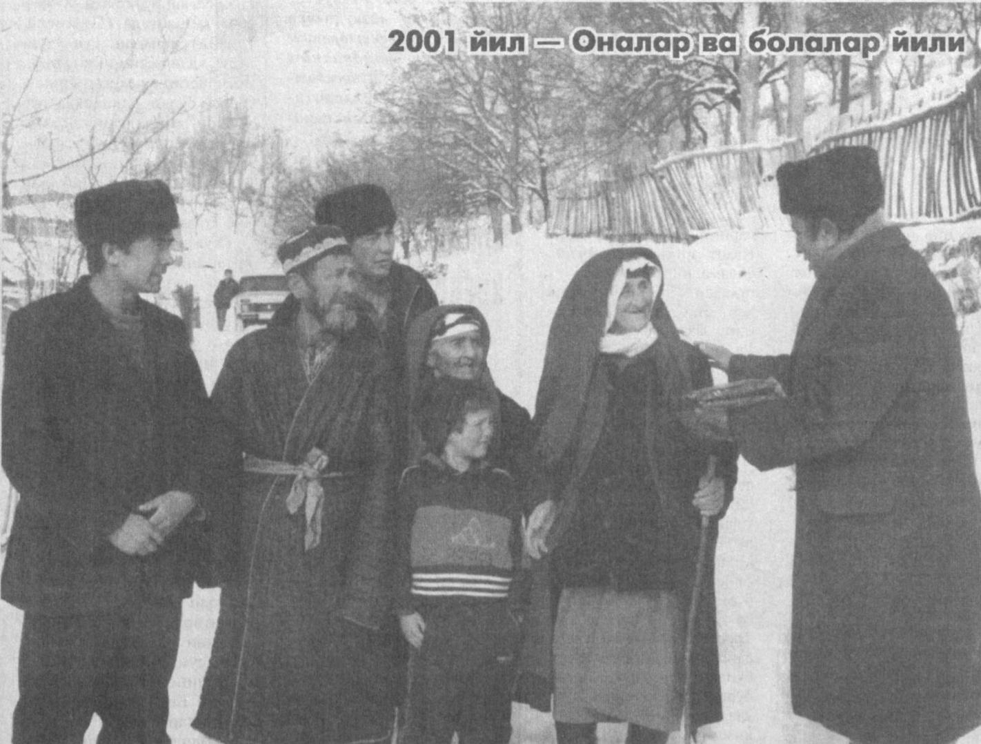
2001 йил — Оналар ва болалар йили

Урушдан кейинги йилларда филолог кадрлар жуда кам бўларди. Тил ва адабиёт институти ва олий ўқув юртиларидаги тил ва адабиёт кафедраларида битта-иккита фан номзоди ё бўлар, ё бўлмасди. Шундай пайтларда илмий ва педагог кадрларни тайёрлаш долзарб масалалардан бири эди.