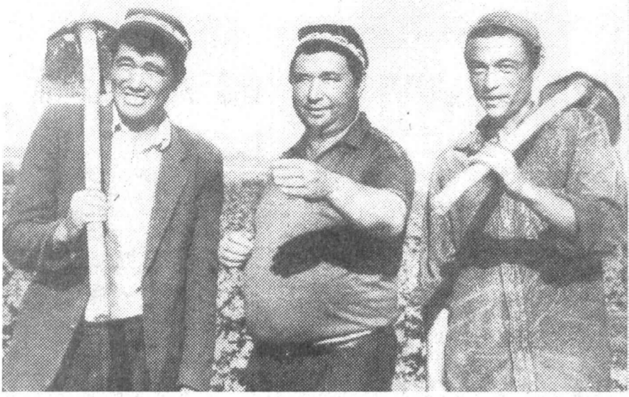
Якшабот туманидаги «Шарқ юлдузи» жамоа-фирма хўжалиги пахтакорлари бу йил 470 гектар ерга экилган гўзаларни парварири қилишяпти. Август ойи ҳосили тўпланида муҳим палла эканлигини шубҳасиз оқин зарбуслар ҳар дақиқани ташвиш билан, экиларни сугориши ва озиқлантириши сингари тадбирларни ўз вақтида адо этишяпти.