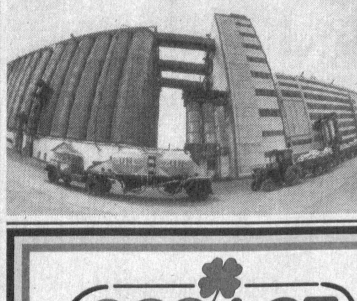
Ғалла мустақиллиги йўлида