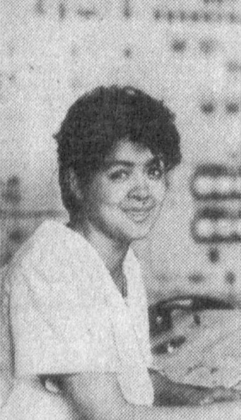
Учқургон «Дон маҳсулотлари» ҳиссадорлик жамияти жамоаси янги ҳисса ҳисобидан маҳсулот тайёралиши бошлади.