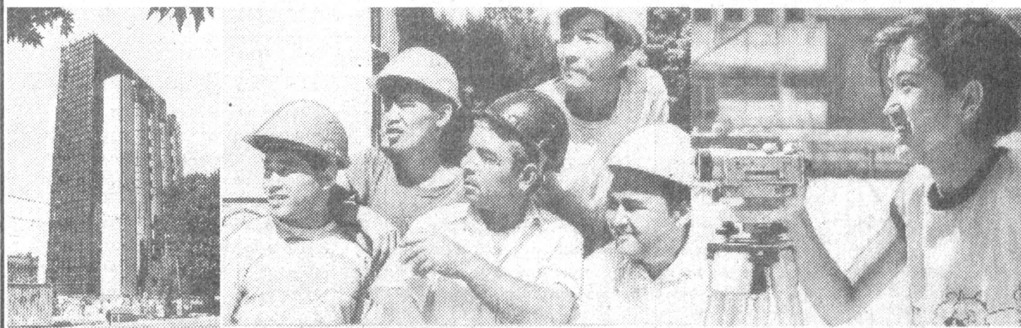
Ўзбекистон Республикаси мустақиллигининг беш йиллиги олдидан пойтахтнинг асосий қўлаб қурилиш ишшоотларида иш қилгани оқибатда. Бағзи бинолар эса фойдаланишга топширилди. Янги кўчалар эса Марказий банк маъмурий биноси қурилиши ҳам яқунланади.