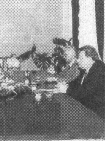
Ислам Каримов шу кунин Германия Федератив Республикасининг «Дойче банк АГ» банки бошқаруви аъзоси Георг Крупп раҳбарлигидаги делегацияни ҳам қабул қилди. Ислам Каримов мамлакатимиз билан Германия Федератив Республикаси ўртасидаги муносабатлар тобора юксалиб