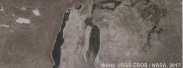
Подготовил Тимур Кайсаров.