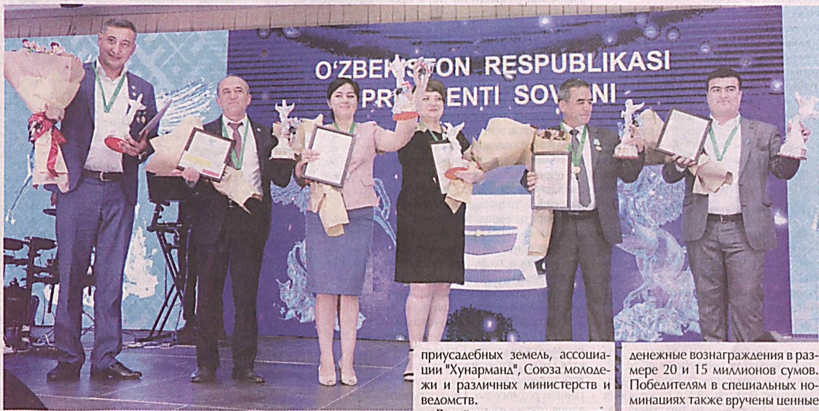
В столице состоялась торжественная церемония награждения победителей республиканского этапа смотра-конкурса "Ташаббус-2019" призами Президента Республики Узбекистан.

В ней приняли участие победители каракалпакстанского, областных и Ташкентского городского этапов этого смотра-конкурса, ответственные работники ряда министерств и ведомств, представители широкой общественности, а также дипломатического корпуса, аккредитованного в нашей стране.