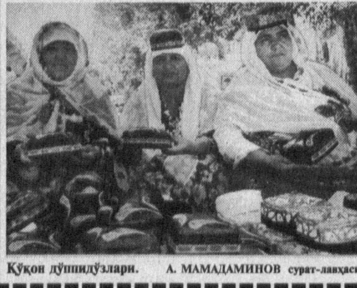
Кўқон дўшпидўзлари. А. МАМАДАМИНОВ сурат-лаҳза.