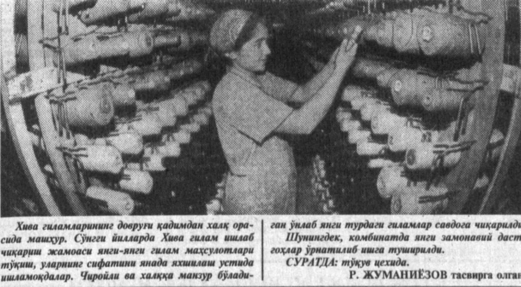
Хива гулламларининг довури қадимдан халқ орасида машҳур. Сўнгги йилларда Хива гуллам ишлаб чиқариш жамoииси янги-янги гуллам маҳсулотлари тўғрисида, уларнинг сифатини янада яхшилаш устида ишламоқдалар. Чиройли ва халққа машҳур бўлади...

«Халқ сўзи» ва ЎзА мухбирлари хабар қилади