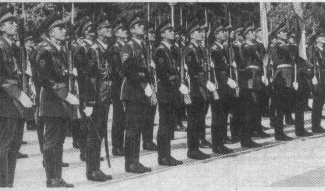
Мен тенгилар тақдир тақозаси туфайли собиқ совет армиясида хизмат қилгандик. Ва ўша хизмат даври ёдимга тушса, ҳали-ҳануз изтироб чекаман...