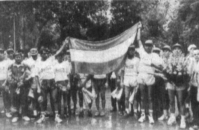
Амир Темури таваллудининг 660 йиллигига бағишлаб Шаҳрисабз — Тошкент йўналиши бўйича ўтказилган супермарафон ниҳоясига етди.

Республика ёшларининг «Камолот» жамғармаси ҳамда Давлат жисмоний тарбия ва спорт қўмитаси ҳамкорлигида ўтказилган мазкур тадбир иштирокчилари, яъни супермарафончилар 5 октябрь кунини Шаҳрисабз шаҳридан старт олишган эди.