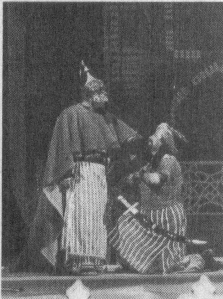
Ўзбекистон Театр арбоблари уюшмаси республика телерадиокомпанияси билан ҳамкорликда соҳибқирон юбилейига бағишлаб «Амир Темур»...

буюклик ва инсонийлик мавзусида фестивал ўтказилди. Унда Қорақалпоғистон Республикаси, вилоятлар, Тошкент шаҳри, шунингдек, қардош Қозғистон ва Қирғизистон театрлари иштирок этди.