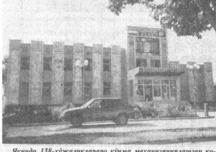
Яқинда 138-сўжалликларро кўчма механизациялашган колонна бунёдкорлари «Табиркорбанк»нинг Уйчи туман бўлими учун янги бино қуриб бериши.

Словакиядаги шина ишлаб чиқарувчи «Матадор» акционерлик жамиятининг Ўзбекистондаги бош вакили "МАТАДОР-Т"