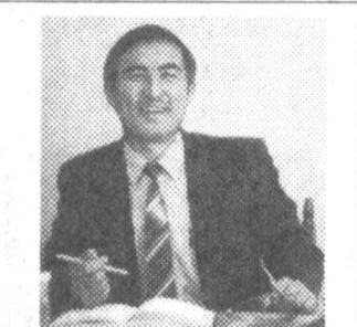
Мирзо ҳам амирини бобом, деб иззатини жойига қўяди. Амир ҳаммиша ҳам мирзонинг унига сездирмай, орқаворотдан унга куз-қулоқ бўлиб юрарди.

Хусайн Қундузда қолдирган Амир Улжайту ва Балхшон волидини Шоҳ Шайх Муҳаммадлар ўз лашкарлари билан ҳозир ноиз бўлдилар ҳамда ниятлари бир эканлигини, батамом Соҳибқирон тарафига ўтганларини ошқор этдилар. Бу қутлуғ айтилиқ эди. Кейин Шибургон ҳокими Муҳаммад хожа опардий ўғли Зиндачашм опардий ҳам лашка-