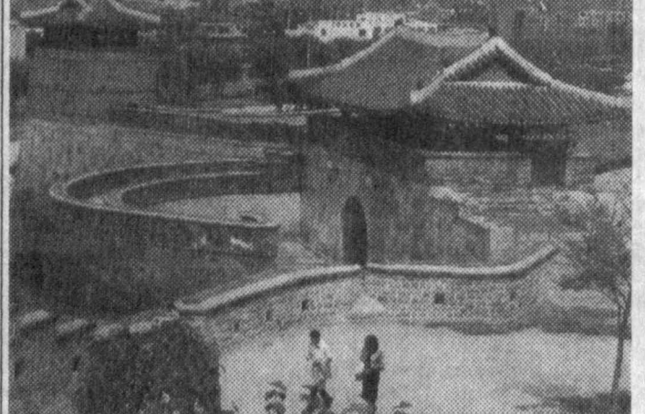
Корея Республикаси. Бу юртни «Субидия боқаралиги ўқаси» деб аташади.