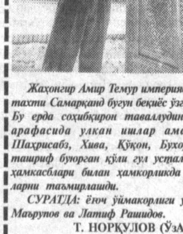
Жаҳонгир Амир Темура империясининг қўна пойтахти Самарқанд буюв беқий ўзғаришлар оғишида. Бу ерда соҳибқирон тавалудининг 660 йиллиги арафасида улкан ишлар амалга оширилди. Шаҳрсаба, Хава, Қўзон, Бухоро, Тошкентдан таширф буюрган қўн кул устидан самарқандлик ҳамкасблари билан ҳамкорликда қадимий обидаларни таъмирлади.

Ҳозир нефрит қабртошнинг 1879 йилда синди-рилган бўлагини қандайлир ўрнатишга, асл ҳолига қайтарилди.