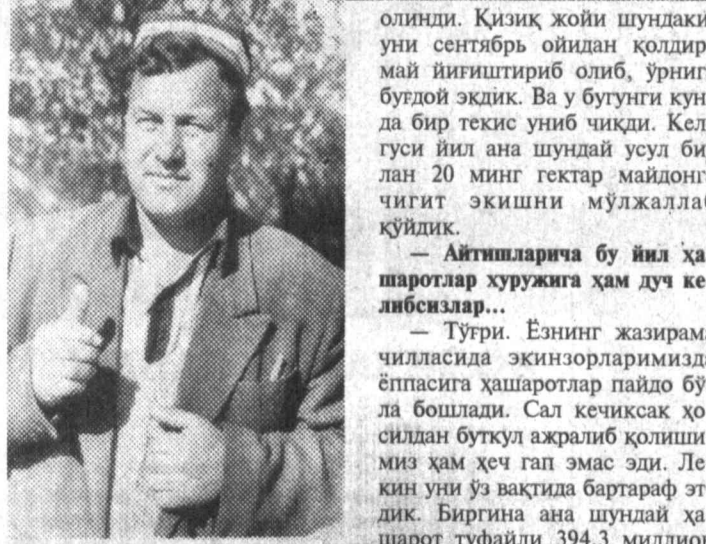
ли табиий шароитта мос ва серҳосил навлар танлай олинганлигидадир, деб биламан. Тан олиш керакки, авваллари воҳда деҳқонлари ерни кузда...