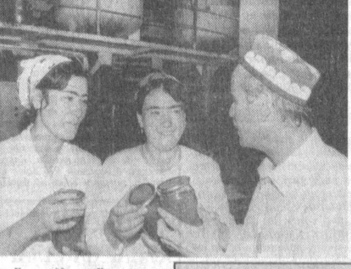
Косовоидagi «Қушон» консерва заводига йилеца 1 миллион шартли бандон ортақ маҳсулот ишлаб чиқарилади. Заводда тайёрланаётган турли хилдаси компотлар, томат, шербатлар, тузланган помидор ва бодринлар вилоят аҳолига мансур бўлган.

«Матонат» жамоаси бу йилги бирга халқаро мусобақаларда голиб чиқди. Россия оқиқ чемпионатида эса ҳамкорларимиз саккизта команда орасида энг яхши натижани қўлга киритиб, катта кубок эгал бўлди. Ўзбекистон Давлат жисмоний тарбия ва спорт қўмитаси раиси Б. Махситов спортчиларни бу улкан ғалаба билан табриқлади. «Матонат» командасининг қирринга кўра, катта кубок Олимпия шон-шухрати музейига топширилди.