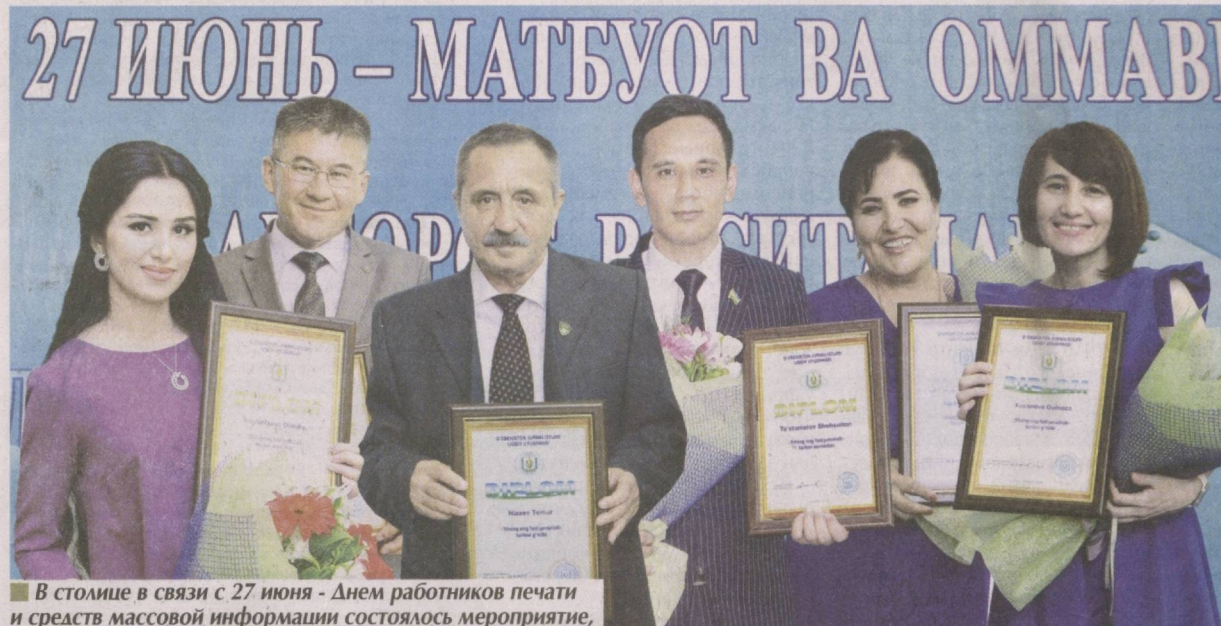
В столице в связи с 27 июня - Днем работников печати и средств массовой информации состоялось мероприятие, посвященное награждению победителей республиканского творческого конкурса "Лучший журналист года", организованного Творческим союзом журналистов Узбекистана.

На мероприятие были приглашены ответственные работники различных министерств и ведомств, представители различных средств массовой информации, ветераны журналистики, студенческая молодежь.