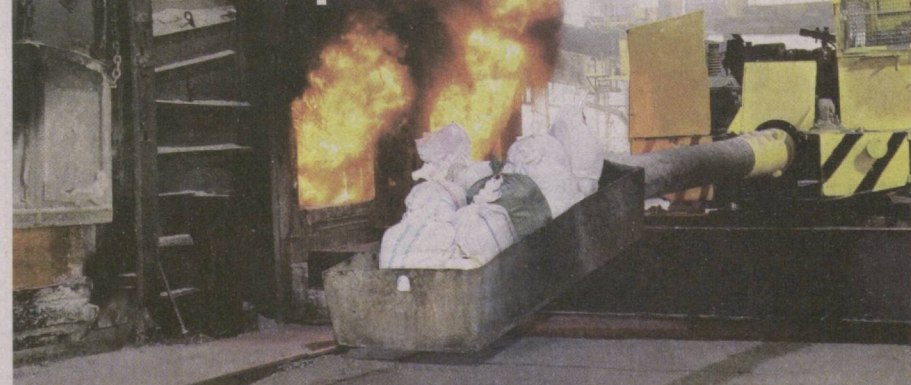
Служба государственной безопасности уничтожила очередную партию наркотиков, изъятых в ходе борьбы с наркобизнесом.

Акция прошла в Международный день борьбы со злоупотреблением наркотическими средствами и их незаконным оборотом.