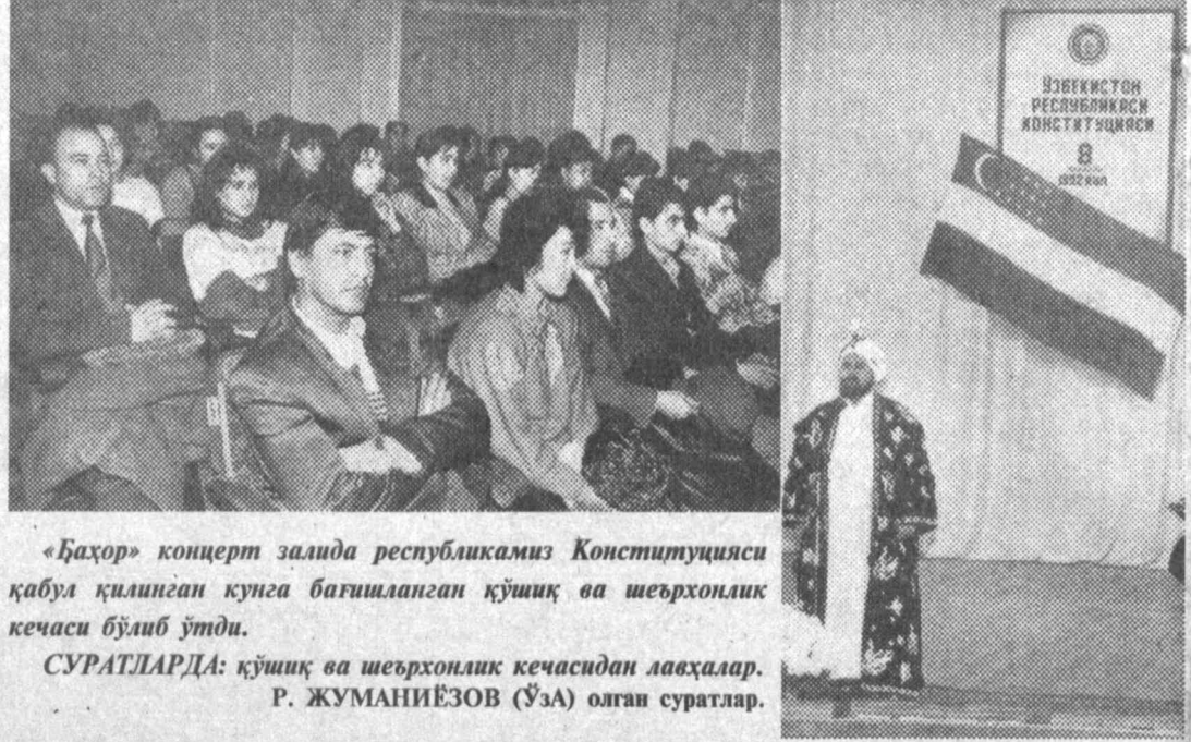
«Баҳор» концерт залда республикамиз Конституцияси қабул қилинган кунга бағишланган кўшиқ ва шевронлик кечаси бўлиб ўтди.