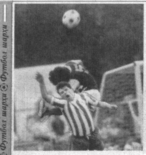
Биз аввалги шарҳларимизда Осиё футбол тарихига назар ташлайдиган бўлсак, финал мусобақалари қитъаннинг шарқий мамлакатига ўтказилган бўлса, албатта, Шарқ, Фарбий кутубида ўтказилса гарб мамлақати терма жамоаси голиб чиққан. Ун биринчи марта ўтказилган қитъа кубоги учун бу йилги баҳсларда ҳам осийликлар шу анъананага содиқ қолишди.

Футбол бўйича Осиё кубоги учун баҳслар тарихига назар ташлайдиган бўлсак, финал мусобақалари қитъаннинг шарқий мамлакатига ўтказилган бўлса, албатта, Шарқ, Фарбий кутубида ўтказилса гарб мамлақати терма жамоаси голиб чиққан. Ун биринчи марта ўтказилган қитъа кубоги учун бу йилги баҳсларда ҳам осийликлар шу анъананага содиқ қолишди.