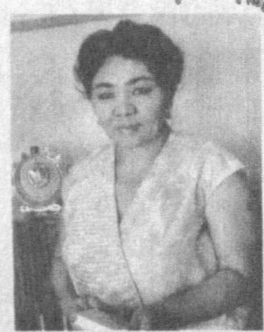
Ҳалима ХУДОЙБЕРДИЕВА. Ўзбекистон халқ шоири