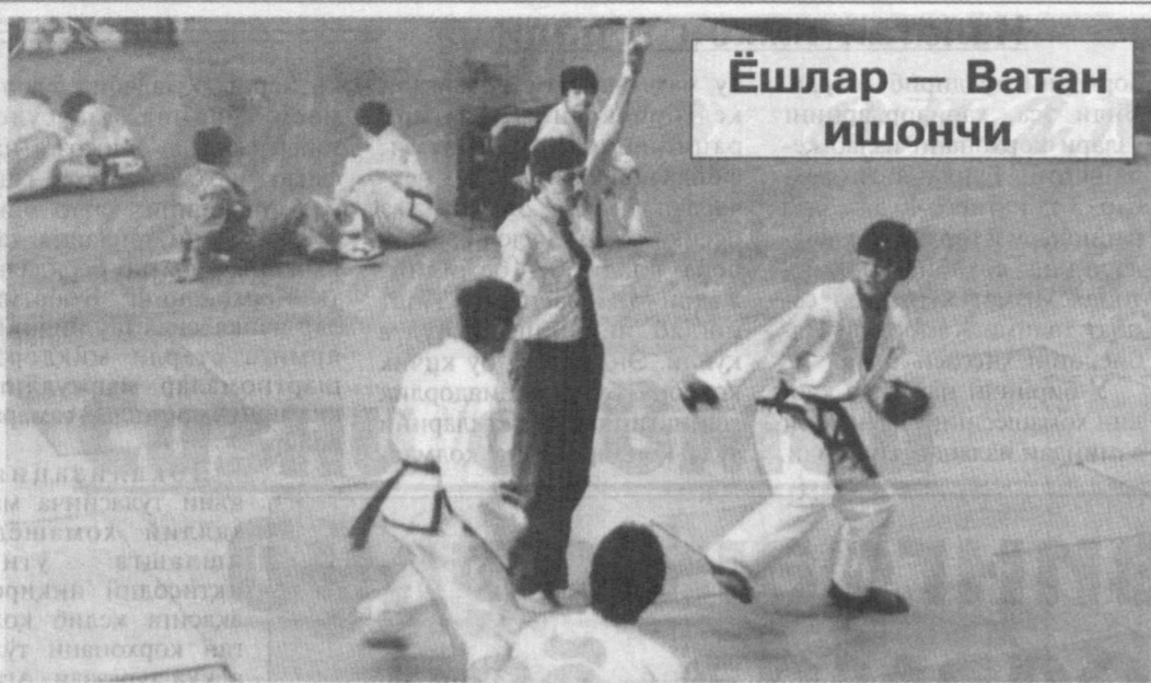
Ёшлар — Ватан ишончи