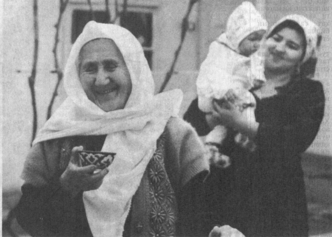
Опоқ доқа рўмоллари ўзларига ярашган, саксоннинг остонасига яқинлашиб қолган Холлада ая Юсупованинг чехраларидаги шодонлик, аввало, юрт тинчлигидан. Хонадоннинг бағри бутунлиги, ҳамини фарзандлар, невараларлари арговида, эъзозидан эканидан. Она учун нури дунёларининг камолини кўришдан ортиқ бахт йўқ. «Магили ўрийдан ҳам ширин-да, — деди Тошкентдаги 2-Чимбой маҳалласи онахони. — Шунинг учун болалар жону дилим». Маҳалла-қўй, катта-кичик бу ширинлуғи аянинг дуаларини олишни ахши кўришди. Чунки улар «Юрт тинч бўлсин, тинч-жонинг соғ бўлсин, топганинг тўйларга буюрсин, фарзандларинг бахтига қарши насиб этсин», деп ниқат қиладилар. Хонадонимиз ободлиги, дастурхонимиз тўқиллиги бу кун айёмларини нишонлаётган шундай волидай мухтарамалар дуаларининг ишобатидан бўлса, не ажаб.

Ислам КАРИМОВ, Ўзбекистон Республикаси Президенти.