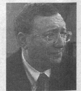
Гусинскийни нима кутмоқда? Бородинни-чи?

Шу кунларда ушбу савол кўпчиликини қизиқтирмакда. Хабарларга қараганда, кунга кеча «Медиа-Мост» холдинг компанияси статкиси В.Гусинскийни Соторадаги ҳамамати биласидан яна сўроқ камерасига олиб келинган. Ийрик ҳажмдаги маблағни ўзлаштирилганда айбланган «Медиа-Мост» раҳбарининг жиноий иши бугун яна Испанияда кўриб чиқилади. Ҳозирча В.Гусинский ушбу хатти-ҳаракатларини сиёсий уйин дея баҳоламакда. Унинг яна бир ҳамюрти, Россия ва Белорусия Иттифоқи Давлат котиби П.Бородиннинг аҳоли эса ундан-да аянчли. Унга Швейцария банклари орқали катта миқдордаги маблағни ўзлаштирилганлик айби қўйилган. 13 март куни Нью-Йоркда ҳибсада ушлаб турилган. П.Бородин инфаркт касаллигига чалинганлиги айтилган эди. Айни пайтда у ҳибсадан озод этилиб, касалхонага ётқизилди.