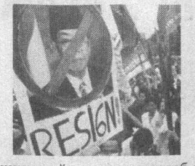
Собиқ раҳбар хайратда

Бир неча кунларки, Индонезия пойтахтида талабаларнинг оммавий намойиши давом этмоқда. Президент саройи яқинига тўпланган минглаб талаба мамлакат раҳбари Абдурахмон Воҳид истеъфога чиқилиши талаб қилаётди. Бироқ Индонезия президенти кеча яна бир бор ўз курсисини тарқатмаслигини таъкидлади. Айни пайтда А.Воҳид парламенти билан ерданидан тўла маҳрум бўлган. Бу эса мамлакат вице-президенти Мегавати Сукарнопутрига давлат раҳбари бўлиш учун яхши имконият яратмоқда.