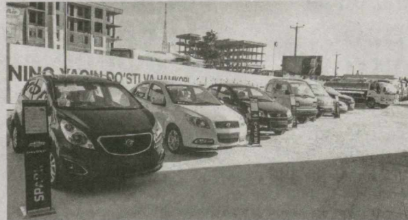
В городе Мазари-Шариф Исламской Республики Афганистан 1-2 июля состоялась выставка "Made in Uzbekistan".

В церемонии открытия мероприятия, организованного Министерством инвестиций и внешней торговли Республики Узбекистан, принял участие представитель официальных делегаций двух стран.