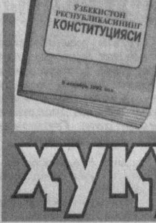
Фармойишда Асосий қонунимиз моҳиятини кенг омига онига сингдиршига қаратилган Конституцияни ўрганиш дастурини яратиш назарда тутилди. Шу мақсадда мутасадди вазирлар, рақбар ходимлар, ҳуқуқшунос олимлар ва мутахассислардан иборат нуфузли комиссия ҳам тузилди. Айни вақтда мазкур комиссия юқорида зикр этилган дастурини ишлаб чиқмоқда, шунингдек, барча даражадаги таълим турлари ҳусунларини инобатга олган ҳолда, Конституцияни ўрганишга оид махус ўқув курслар, дарсликлар яратиш учун маълум муаллифлар жамоаларини тасдиқлади. Тегинли экспертлар гуруҳларига мўжалланаётган ўқитиш дастурларини, методик кўрсатмаларни ва бошқа дидактик воситаларга қўйилган талабларни ишлаб чиқилиши топишти. Шу асосда мактабга тарбия муассасаларида тарбияланувчилар ва ўрта мактаб бошланғич синф ўқувчилари, умумий ўрта таълим тизими ўқувчилари, ўрта махус, касб-ҳунар коллежлари ва академик лицейлар ўқувчилари учун алоҳида дастур ҳамда методикалар ишлаб чиқилмоқда.

Конституциянинг худди ана шу говий, фалсафий, ҳуқуқий-мафқуравий, маърифий-тарбиявий салоҳиятини, мазмун-моҳиятини аҳоли кенг қатламлари, айниқса, ёшлар онига сингдирш мақсадида муҳтарам Президентимизнинг «Ўзбекистон Республикаси Конституциясини ўрганишни ташкил этиш тўғрисидаги Фармойиш қабул қилинди».