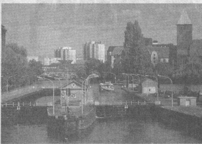
(Давоми. Боши 1-бетда).

иқтисодиётини таназулга олиб келади, дея баъорат қилган эди. Бироқ вақт бу баъоратнинг пуч эканлигини кўрсатди. Икки мамлакатнинг бир-лашувидан сўнг иқтисодиётда тенглаштирув сисёти муваффақиятли ўтказилди. Ҳозирда жаҳон бозорига немис маркасининг қадри юқори эканлиги ҳам фикримиз далилидир. ГФР 16 федерал ҳудудлардан ташкил топган бўлиб, ҳар бир федерал ҳудуд ўз конституцияси, парламенти ва ҳукуматига эга. Давлат бошлиғи федерал президент ҳисобланиб, у Федерал Кенгашининг махус чакирғи билан беш йил муддатга сайланади. Мамлакатда қонун чиқарув ҳуқуқат — парламент бўлиб, у Бундестаг — депутатлар палатаси ва Бундестаг — федерал ҳудудлар палатасидан иборат. Бундестагта ҳар тўрт йилда депутатлар сайланади. Мамлакат сисёсий ҳаётида бир неча сисёсий партия ва гуруҳлар фаол иштирок этиди. Аймо Бундестагта бўлган сўнги сайловда нуфузли икки партия — Германия социал-демократлар партияси ва Христиан-демократлар иттифоқи энг кўп ўрин олишти муваффақ бўлди. Германия жаҳондаги ривожланган «кучли еттилик» давлатлар орасида АҚШ ва Япониядан кейин учинчи ўринни эгаллайди.