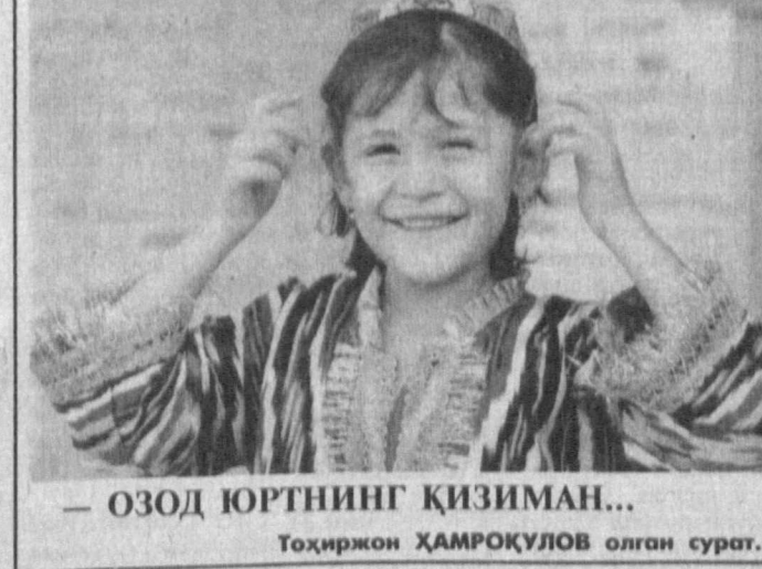
— ОЗОД ЮРТНИНГ ҚИЗИМАН...

Қашқадарё соҳилда яна бир кошона Қашқадарё соҳилида жойлашган бу санаторийнинг ҳавоси тоза, мевали ва монзарали дархотлар қўлланган ёзда ерга тангдек кўш тушмоқда.