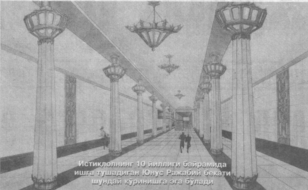
(Давоми. Боши 1-бетда).

Айни пайтда ушбу бекатлар оралиғидаги Бўсўс канали устидан метро кўприги барпо этилмоқда. Айниқса, бу ишда 1, 2-қурилиш-монтаж бошқармасининг қурувчи, таъмирловчи ва бургуловчиларининг ҳиссаси катта бўлаётир. Ватанимиз мустақиллигининг 10 йиллиги арафасида