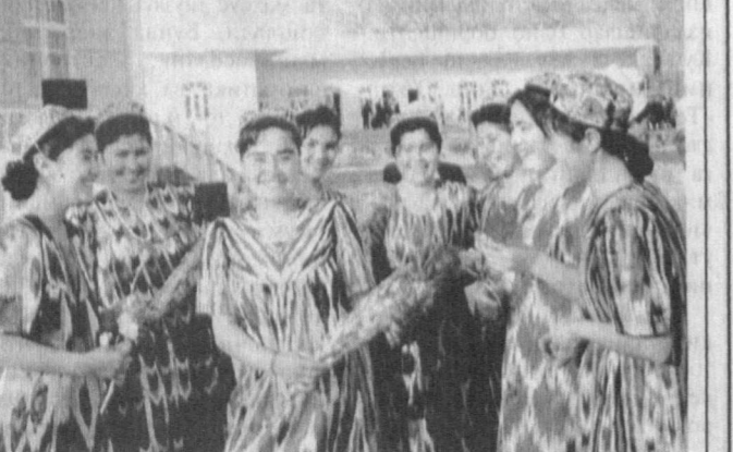
Ўзбегимнинг қизлари...