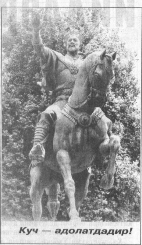
Куч — адолатдадир!

1993 йил давомида Ватанимиз тарихига зарҳал ҳарфлар билан битилдиган бундай воқеалар жуда кўп бўлди.