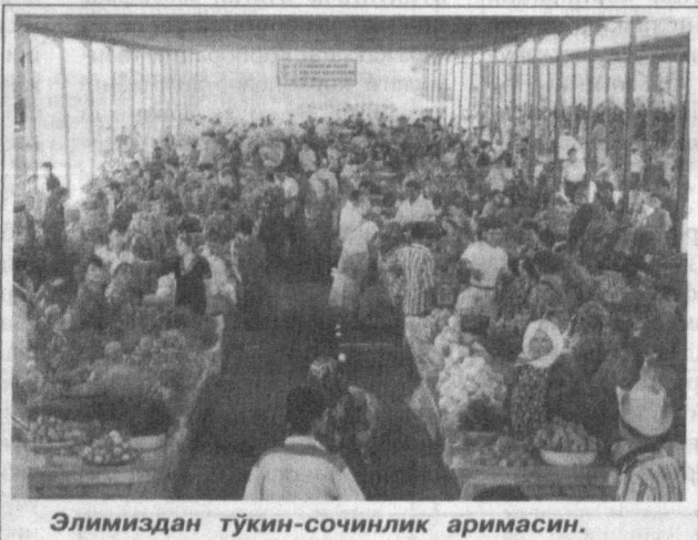
Элимиздан тўкин-сочинлик аримасин.

Шунинг учун ҳам тетапож қадамларини залворли одимларга айлантираётган ёш давлатнинг раҳбари Ўзбекистоннинг ташқи дунё билан алоқаларини кучайтириши, айниқса, иқтисодий соҳадаги ҳамкорликни мустаҳкамлашни устувор вазифа қилиб белгилади.