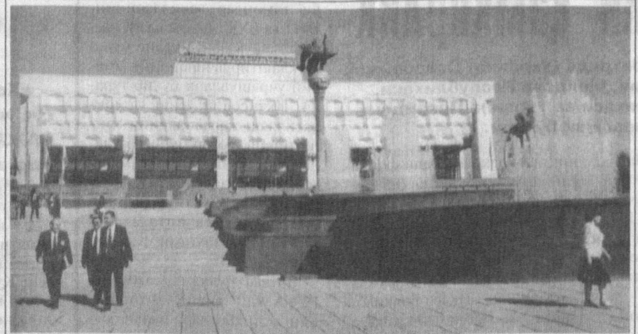
«Обод бўлсин юртимиз, шод бўлсин қўнғилимиз!» Давлатимиз раҳбари «Туркистон» саройи очилишида ана шундай ният қилгандилар.

бўлмас эди. Эҳтимолки, Каримов можаро энди қуртак отаётганда уни баргараф этиб, халқро ҳамдўстликнинг миллиардлаб маблағини тежаб қолаётгандир.