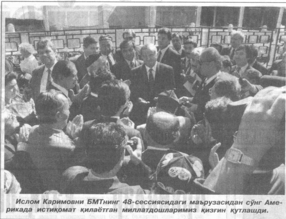
Ислон Каримовни БМТнинг 48-сессиясидаги маърузасидан сўнг Американида истиқомат қилаётган миллатдошларимиз қизгин кутлашди.

шининг мажлисида муҳокама қилиш учун ахборот тайёрлаш мақсадида ишларнинг аҳолини батафсил ўрганиш ва фактлар тўплаш учун Сизнинг шахсий вакилларингизни минтакамизга юборишингизни сўрайман.