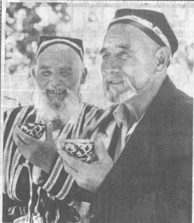
Қарилик гашти...