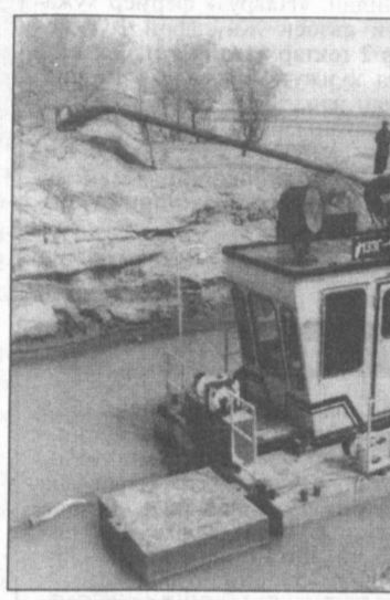
Диган, нисбатан арзон экскаватор моделини яратиш устида бир неча ой давомида иш олиб бори. Натижанда «ЭО-41-11» мақсада мувофиқ деб топилди.

Активдорлик жамияти кейинги йили 23 фаолиятини, нияҳат даражада кенгайтириди. Кўп йиллар давомида фақат катта-кичиқ экскаваторларни таъмирлаш билан шугулланиб келган жамоа эндиликда экскаватор ҳам ишлаб чиқармоқда.